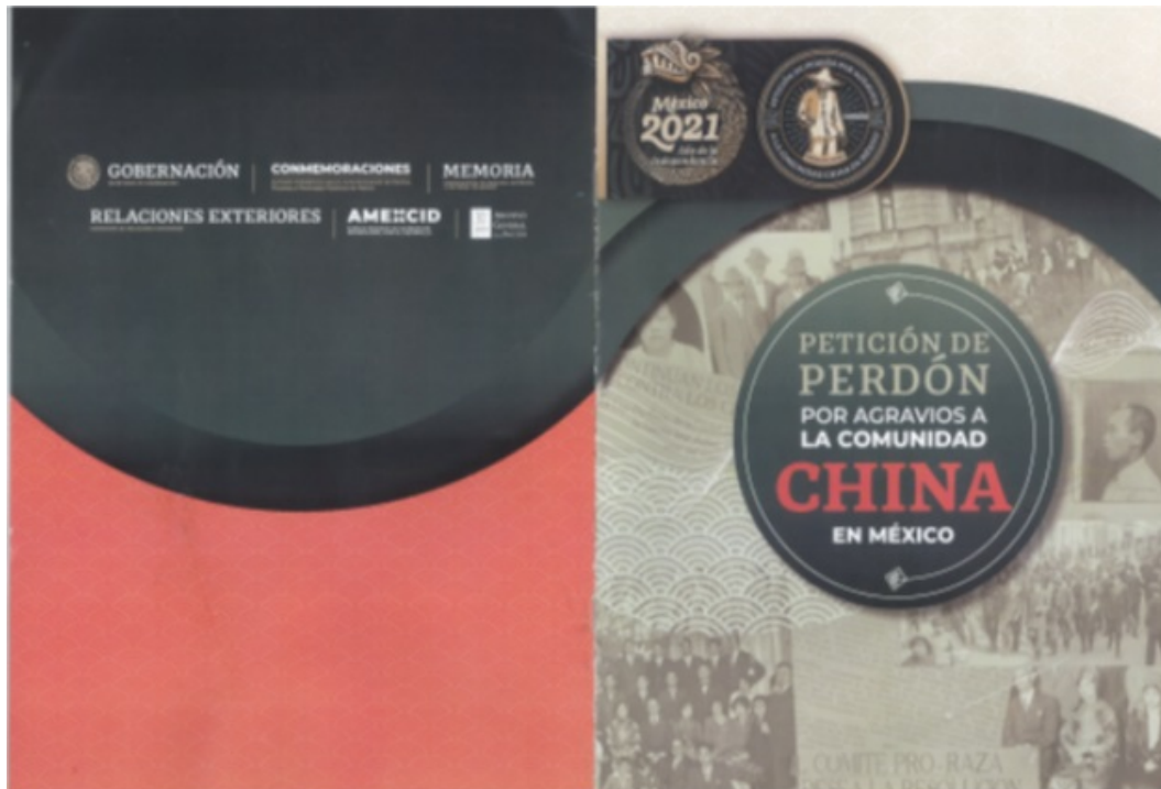
Afiche de la ceremonia Petición de Perdón por Agravios a la Comunidad China en México

Volviendo la vista al pasado de la historia mexicana, recordemos que durante los últimos 30 años del siglo XIX, surgieron y se consolidaron las primeras comunidades de chinos en el país además, fue el momento en el que iniciaron los calificativos despectivos hacia los chinos: opiómanos, ojos de gato, sucios, portadores de diferentes enfermedades, incivilizados, raza inferior, amenaza amarilla, amoraes, perversos, plaga indeseable, entre otros.