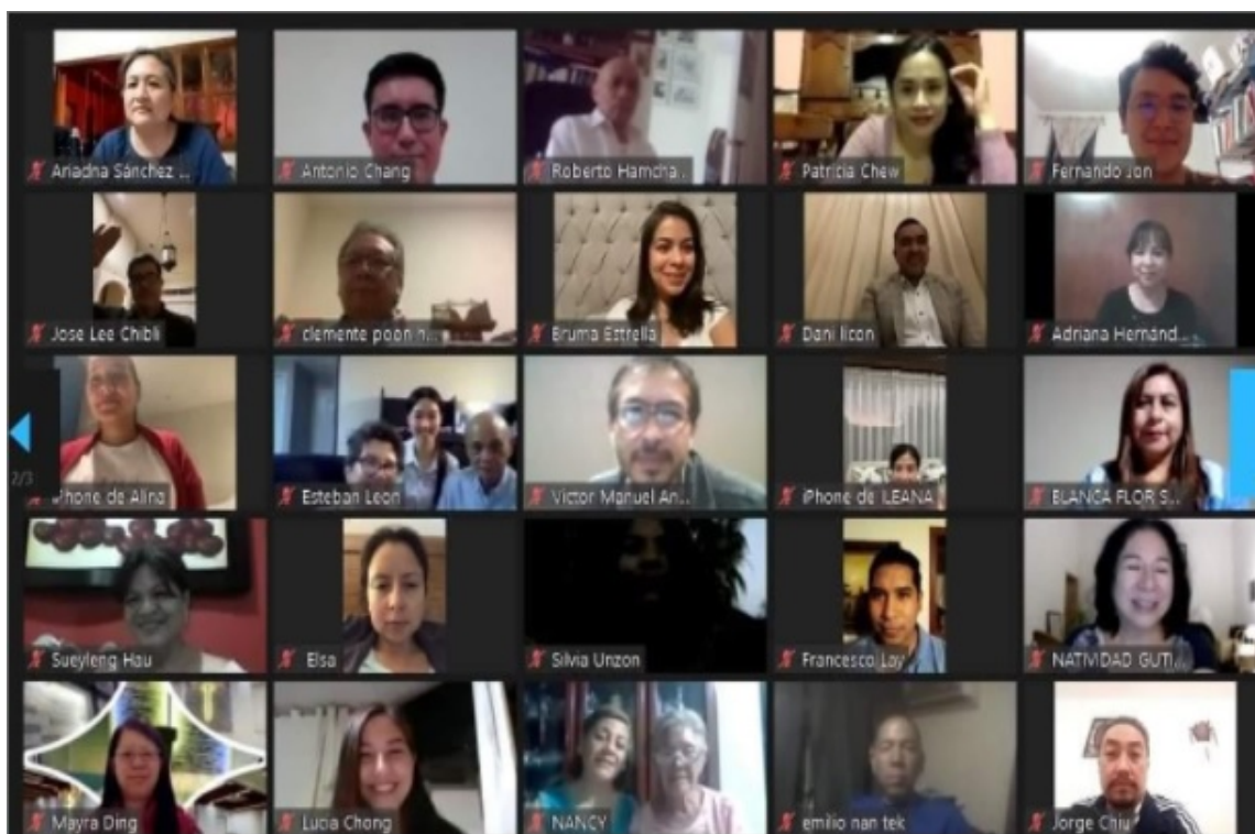
Foto grupal del Primer Encuentro de Comunidades y Asociaciones Chinas en México

El 26 de junio de 2021, se llevó a cabo el Primer Encuentro de Comunidades y Asociaciones Chinas en México donde participaron chinos y descendientes de chinos, evento en el cual pudieron conocerse y reencontrarse los representantes de las diversas colectividades chinas del país, allí se unieron las voces de muchos para intentar saber más de las comunidades chinas y sus descendientes, ocasión en la que surgieron una serie de preguntas: ¿Cómo se organizan?, ¿Quiénes las conforman? ¿De qué regiones de China proceden? ¿Qué hacen? ¿A qué familias pertenecen?