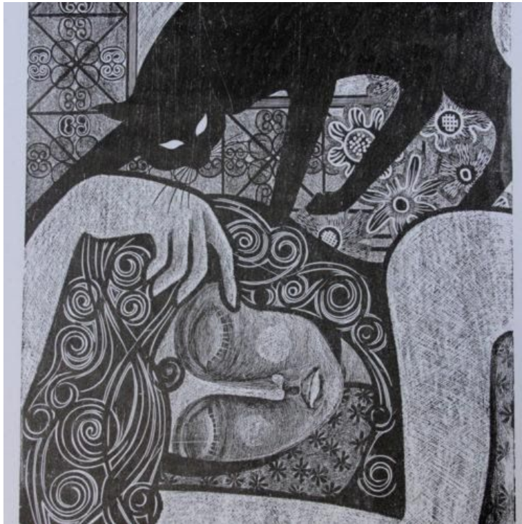
Arte de José Huerto Wong