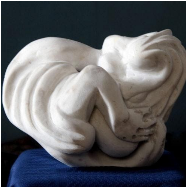
Arte de José Huerto Wong (Fotógrafo: Carlos Chong)