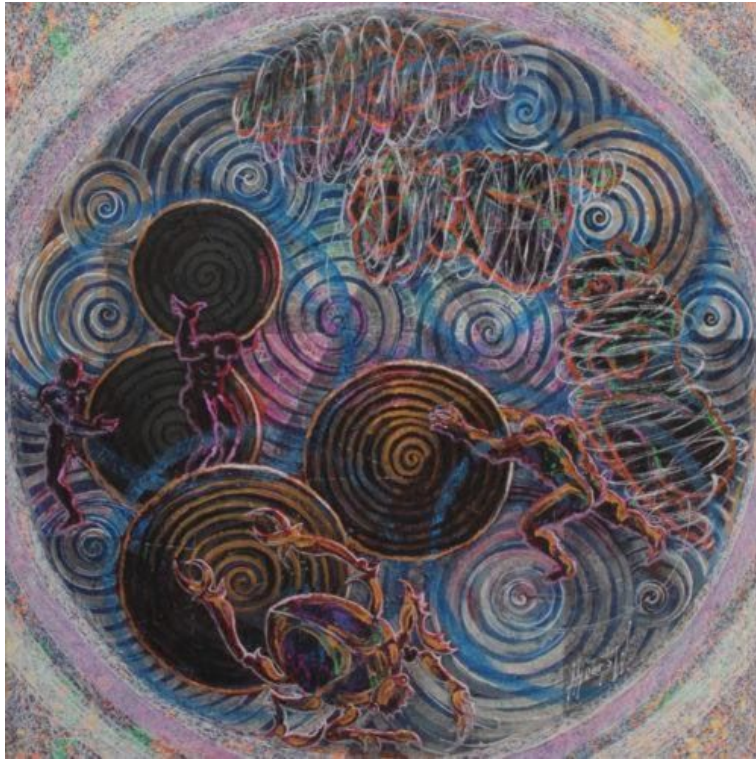
Arte de José Huerto Wong