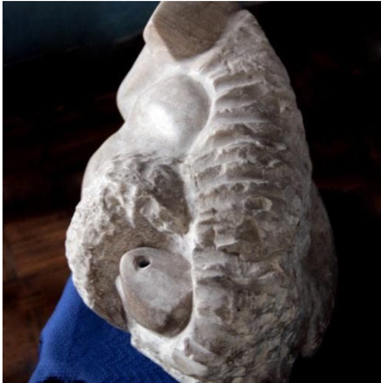
Arte de José Huerto Wong