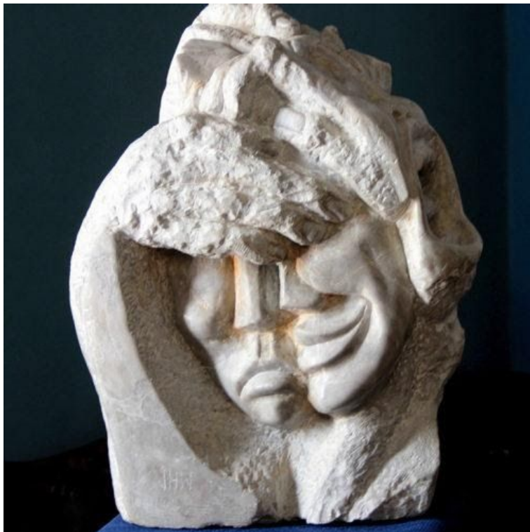
Arte de José Huerto Wong