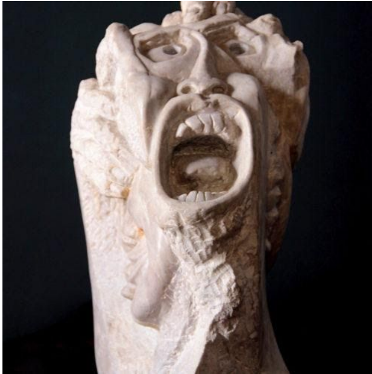
Arte de José Huerto Wong