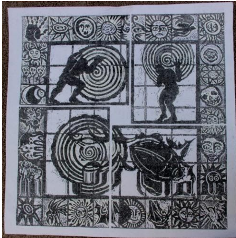
Arte de José Huerto Wong