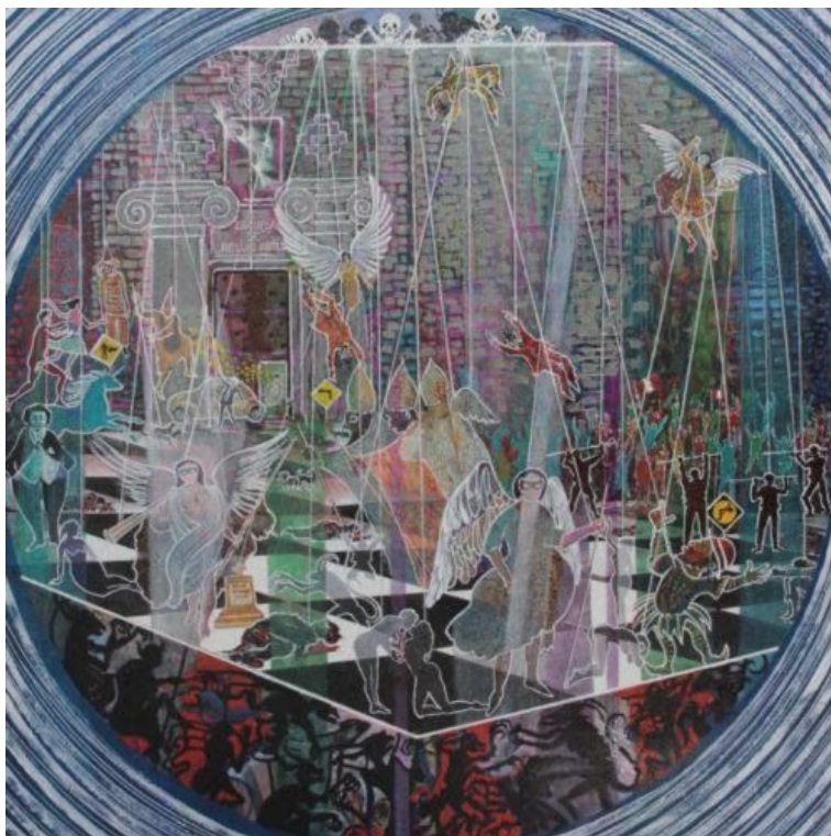
Arte de José Huerto Wong