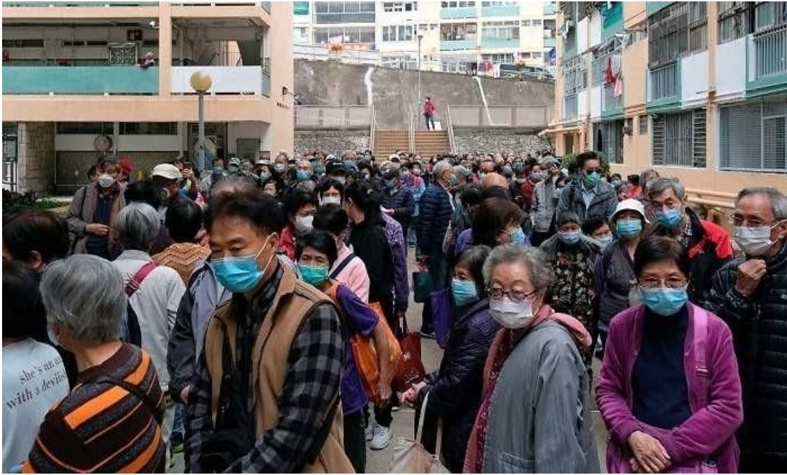
La tecnología utilizada normalmente en seguridad, sirvió también para rastrear el movimiento de la enfermedad

Sin embargo, existieron algunas dificultades para su aplicación efectiva, pues las cámaras tienen dificultad para reconocer rostros parcialmente cubiertos, e incluso, con una de las mejores tecnologías, la identificación en grandes multitudes es complicada. Es aquí donde entra en juego otros componentes de inteligencia . El rastreo de las personas a través de sus dispositivos móviles, el uso de aplicaciones interactivas, el desarrollo de nuevos sistemas de reconocimiento facial que requieran solo la parte superior de rostro, o el uso de cámaras de calor, hacen que el sistema de rastreo del coronavirus tenga una sofisticación mucho mayor. A inicios de este año, el representante de salud pública de la Universidad de Hong Kong, Gabriel Leung, dijo que la escala de tiempo para “reconocer, caracterizar, y reportar información” había mejorado enormemente desde el momento del brote de la enfermedad.[2]