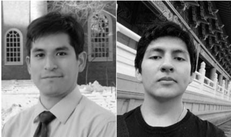
Autores: Marco Carrasco-Villanueva (Harvard), Ted Pari-Quispe (UNMSM)

A inicios de este año se hizo de conocimiento masivo la existencia de un nuevo virus en el centro de China capaz de ocasionar graves problemas a la salud pública y de expandirse desmedidamente fuera de su lugar de origen. La lucha contra esta enfermedad fue, de hecho, un proceso de aprendizaje continuo, y cuando ya se tuvo suficiente información acerca de los mecanismos de contingencia, se pudieron aplicar medidas paliativas que lentamente fueron disminuyendo los casos activos de contagio. De esta experiencia es muy importante notar un elemento: la información.