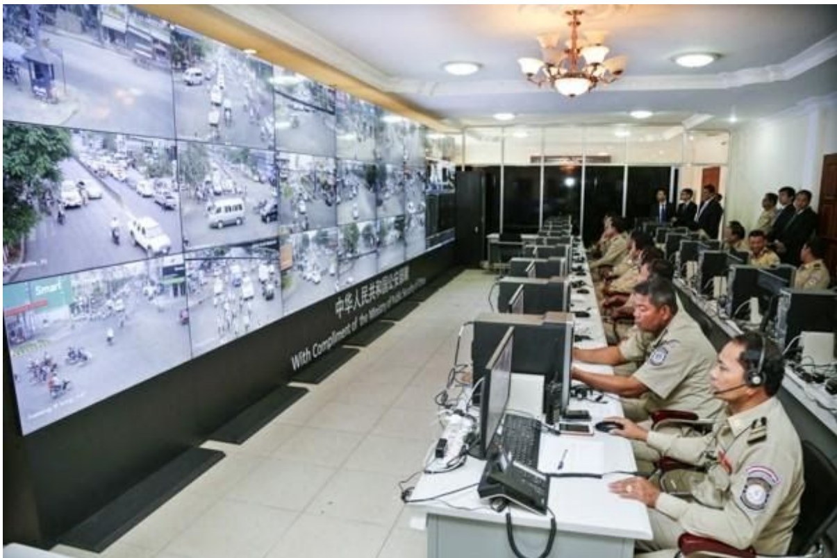
La policía observa los monitores conectados a cámaras de vigilancia donadas por China en Camboya

identifican cada automóvil que entra y sale del perímetro del centro urbano, capturando y analizando las identidades de sus ocupantes. La compañía china de telecomunicaciones Huawei indica que son sus cámaras las que provocaron una caída del 46% en la tasa de criminalidad regional en 2015. Similares casos son vistos en Uganda, Mongolia y Zimbabue.[4]